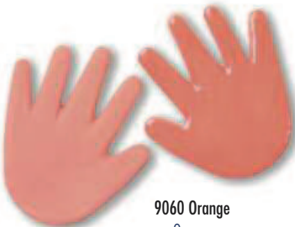
9060 Orange Orange