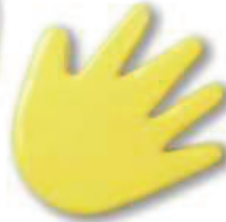
9042 Hellgelb Yellow