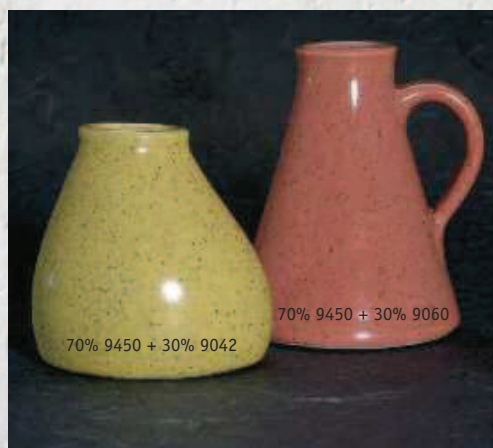
70% 9450 + 30% 9042