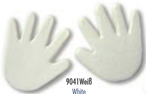
9041 Weiß White