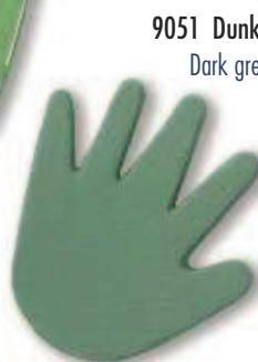
9051 Dunkelgrün Dark green