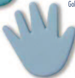
9045 Hellblau Light blue