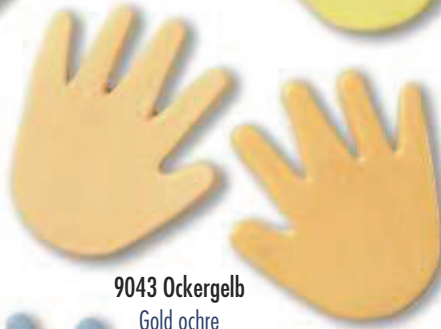
9043 Ockergelb Gold ochre