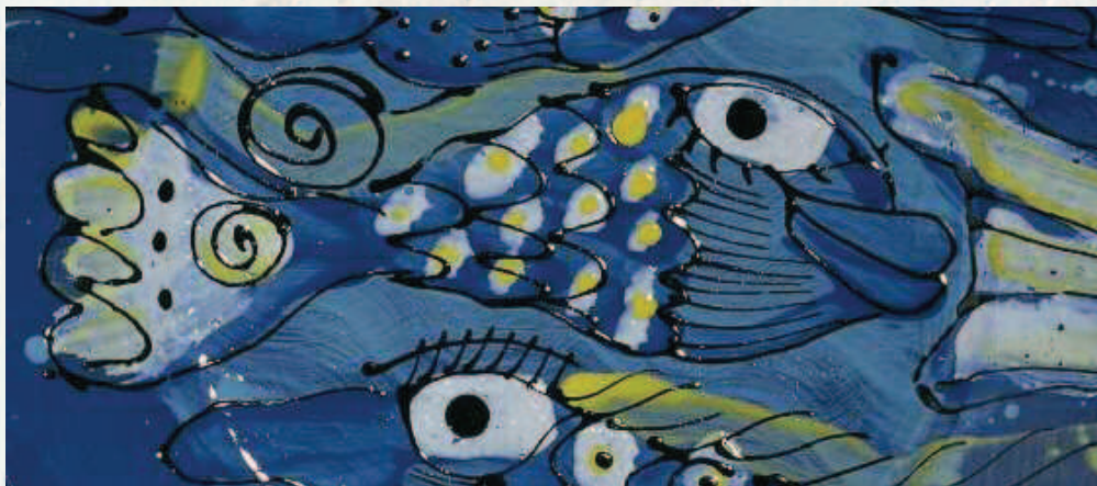
Mirjam Rückert · Münster

Trabajos facilísimos con engobes líquidos de BOTZ: Tarros de 200 ml y 800 ml, económicos para el manejo fácil, pintura de contornos claros y colores relucientes. Pueden ser aplicados sobre arcilla dura (cuero) o en cerámica bizcochada. Los engobes líquidos de BOTZ son ideales para aplicar mediante pera. Los modelos dibujados con los globos de caucho permanecen sobre la cerámica.