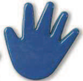
9046 Mittelblau Bright blue