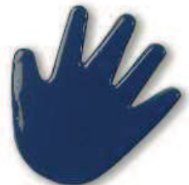
9047 Dunkelblau Dark blue