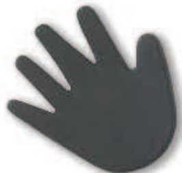
9048 Schwarz Black