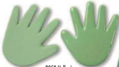
9050 Hellgrün Bright green