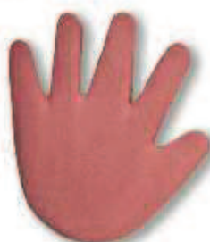
9061 Dunkelrot Red