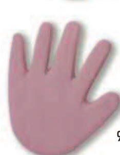
9054 Rot Pink