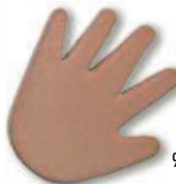
9053 Hellbraun Light brown