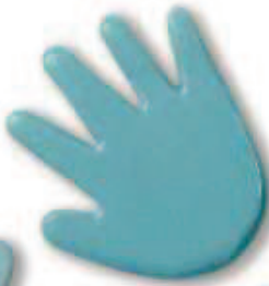
9044 Türkis Turquoise