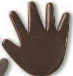
9052 Dunkelbraun Dark brown